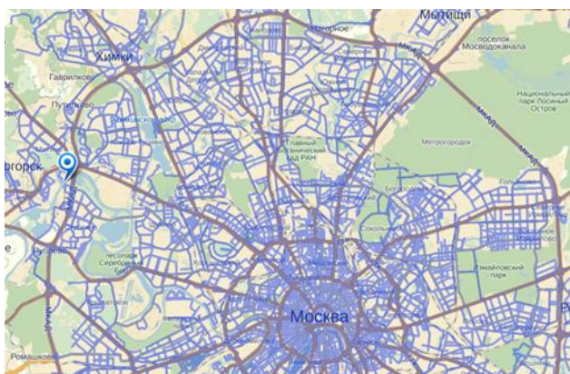
モスクワ・クロッカス国際展示場地図

Russia, 125124, Moscow, 3-ya ul. Yamskogo Polya, D. 14/16